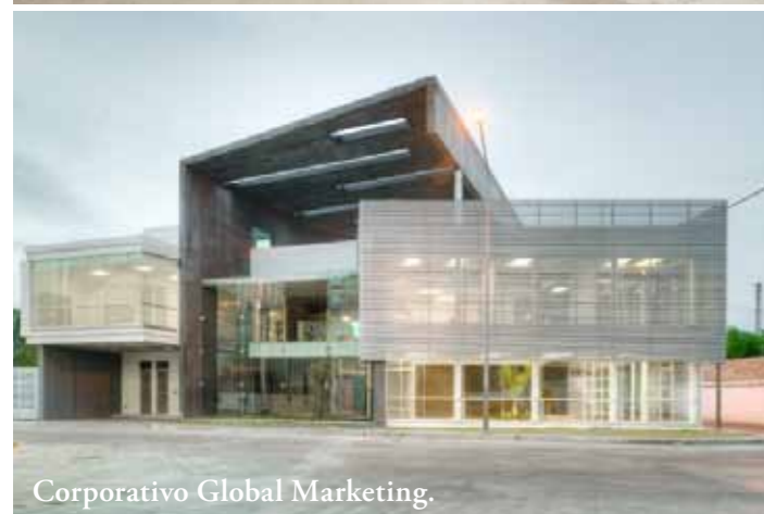
Corporativo Global Marketing.