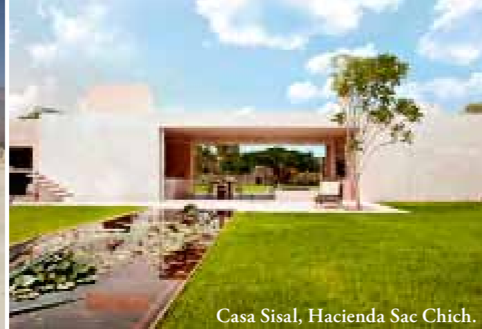
Casa Sisal, Hacienda Sac Chich.