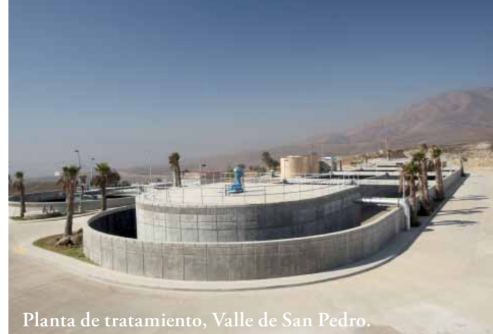
Planta de tratamiento, Valle de San Pedro.