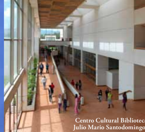
Centro Cultural Biblioteca Julio Mario Santodomingo.