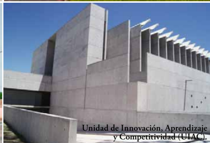
Unidad de Innovación, Aprendizaje y Competitividad (UIAC).